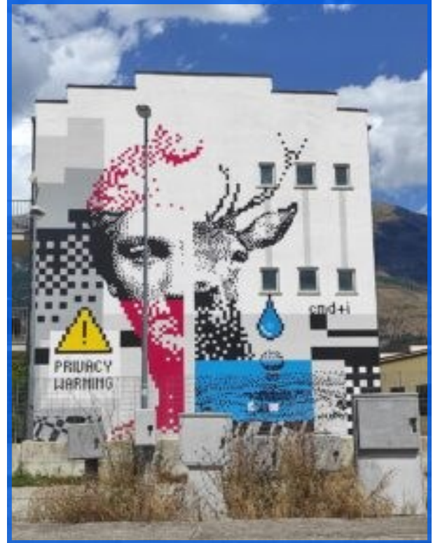
Murales Scuola primaria Lombardo Radice, Sulmona - "Diana e Atteone"